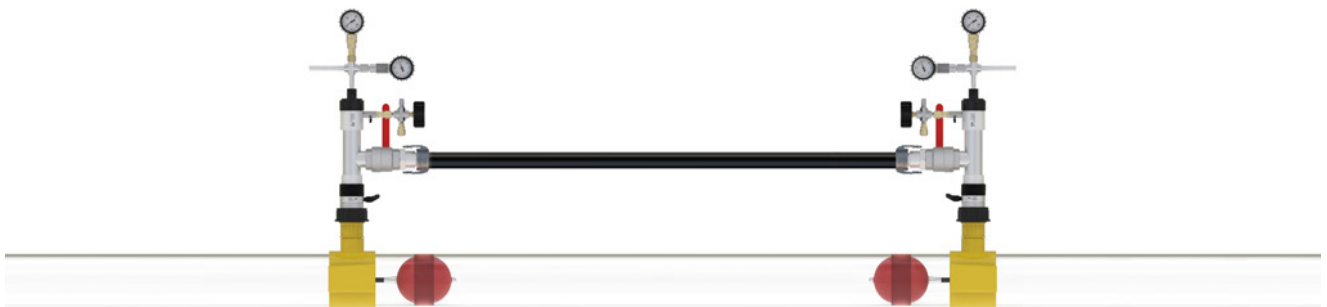
Afb. 2 van 3