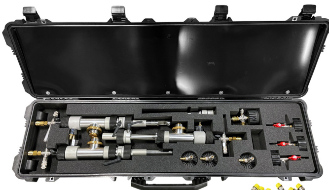
P3 Compact set t.b.v DN 63 – DN 125

Kortom: dezelfde kwaliteit en veiligheid in een compacte uitvoering.